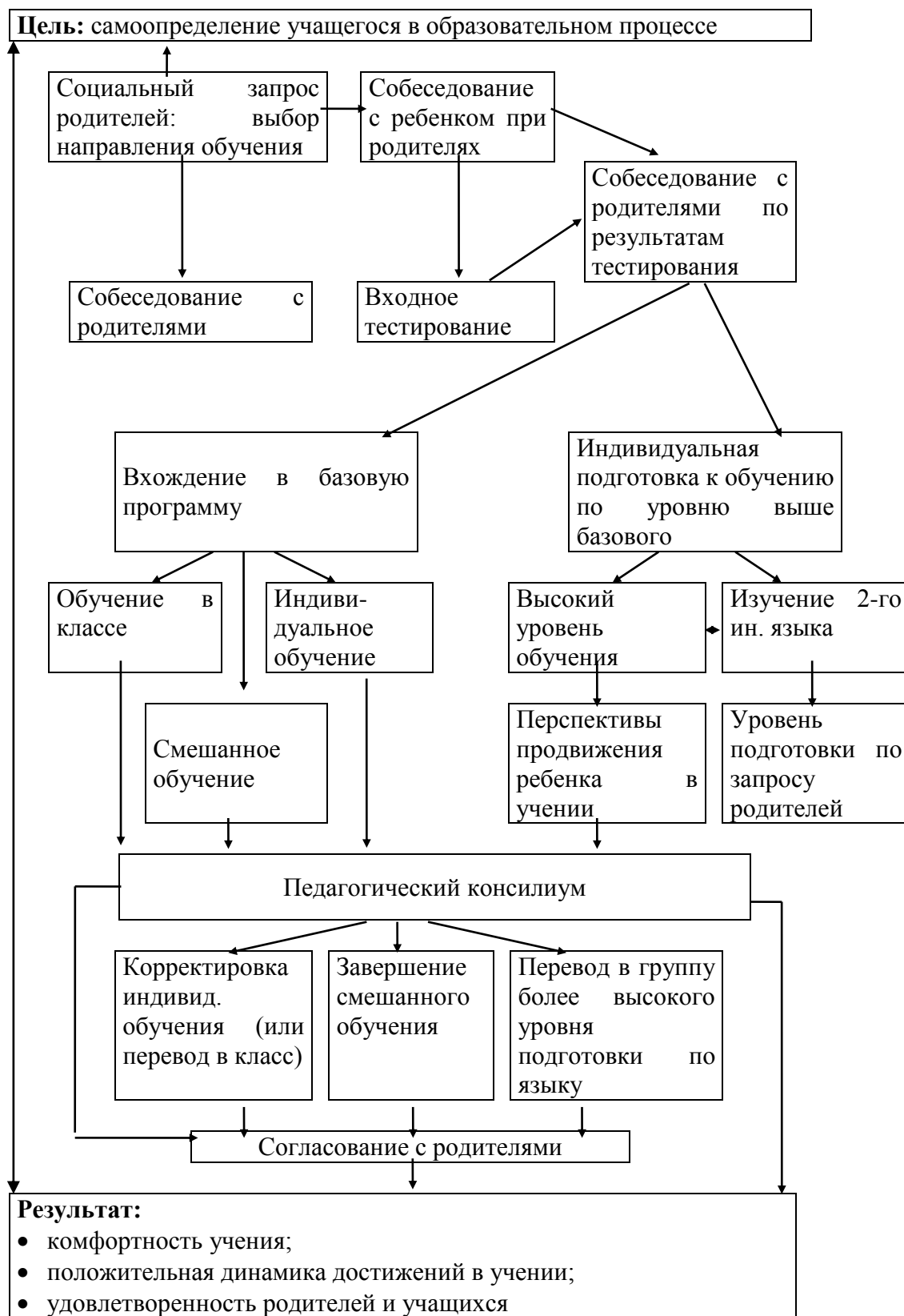
Схема 1 Технология построения и изменения индивидуального образовательного маршрута ученика